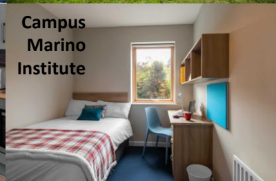
Campus Marino Institute