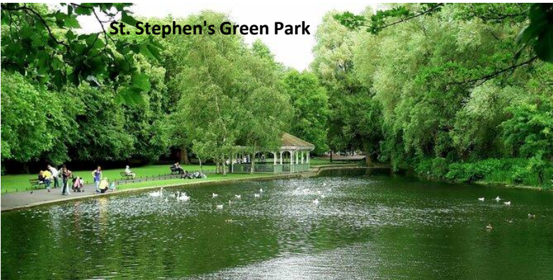
St. Stephen's Green Park